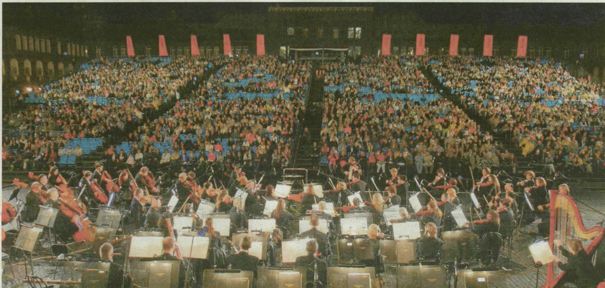
Az eső miatt fél órával később, este kilenc helyett fél tízkor kezdődött a koncert, ám a közönség nagy része kitartott.