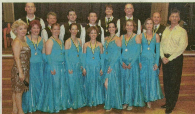
Csapatkép. Báltermi táncok kategóriában győztek.

A hét pár alkotta felnőtt hobbicsapat tagjai mindössze néhány éve választották ki kapcsolódásként a táncot. Hentente egy-két órát gyakorol-