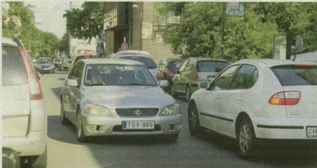
A két parkoló autósor között cipőkanállal fér el a hídra igyekvő mellett a szembejövő.