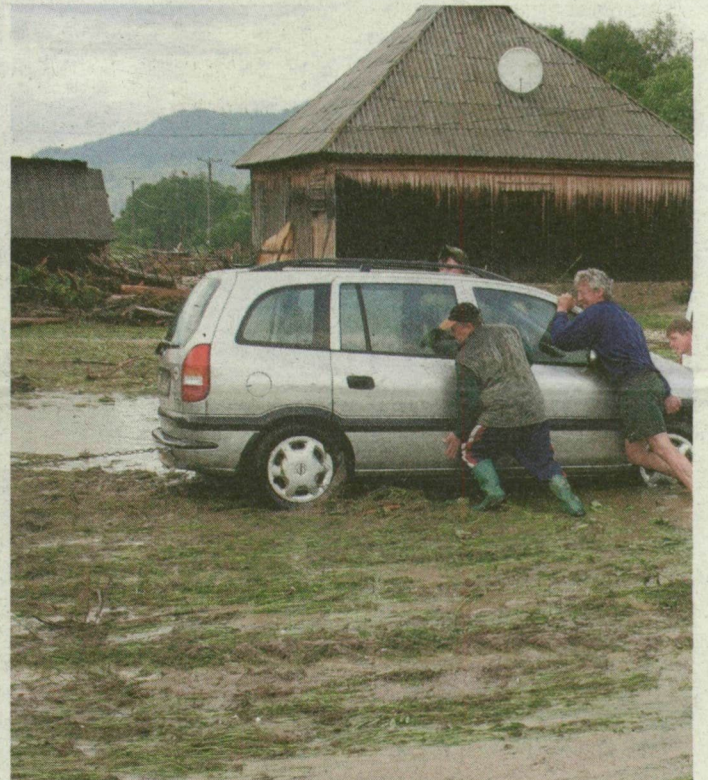
Megpróbálták kiszabadítani az elakadt autókat a sárból.