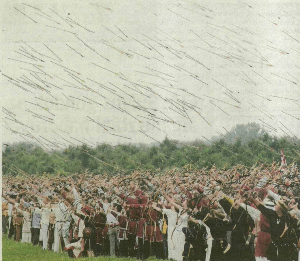
Repülő nyilak és rózsák. Több mint 1600 íjász lőtt együtt az ópusztaszeri Nyílzáporban. A szőregi rózsafesztivál felvonulói pedig szirmokat szórtak a közönség közé.