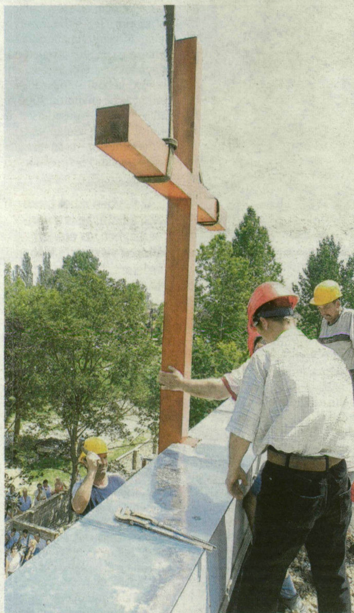
Daru emelte be a homlokzatra a négy méteres keresztet.

KÜBEKHÁZA. Daruval helyezték négy méteres keresztet Kübekházán a most épülő Reménység katolikus iskola homlokzatára pénteken.