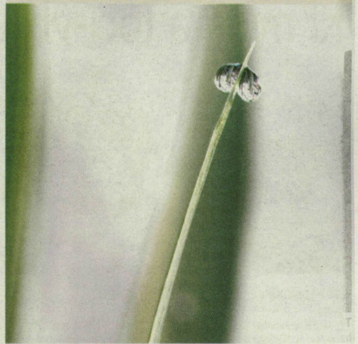
Hajnaltól, nem sokkal napfelkelte után harmat lepi el a füvet. Szegedi olvasónk Fodortelepen készítette felvételét a fűszálon pihenő harmatcsepről.