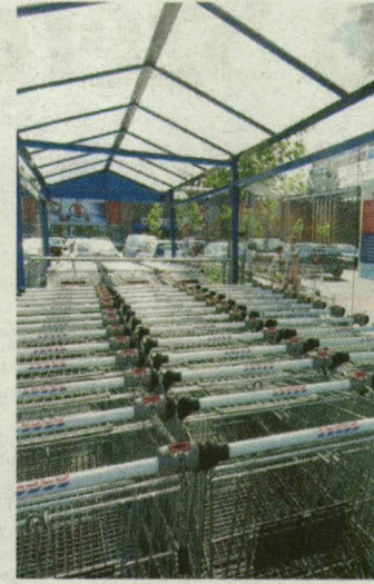
Jól ismert kép: kocsisor a hipermarketnél.

leg a Spar „lakik”, a telek a Szeviép-csoport tulajdona. Egy sarokkal kintebb, a Kálvária sugárút és a Fonógyári út találkozásánál is letelepedhet kereskedelmi centrum az egykori Budalakk területén, ami jelenleg a KÉSZ-csoporté.