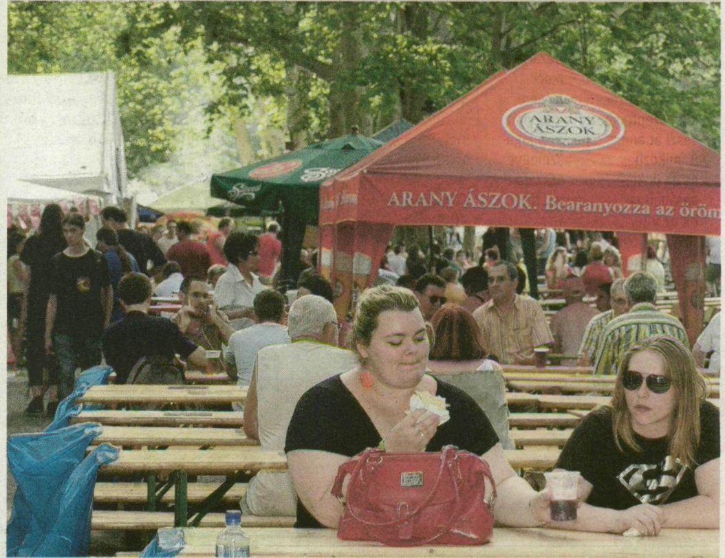
Tegnap kezdődött és vasárnapig tart a XVIII. Szegedi sörfesztivál. Az első vendégek már tudják, hogy az újszegedi ligetben közel 40 vendéglátó várja a látogatókat. Hagyományos fesztiválételeket, grillkülönlegességeket és több mint 50-féle sört kínálnak.