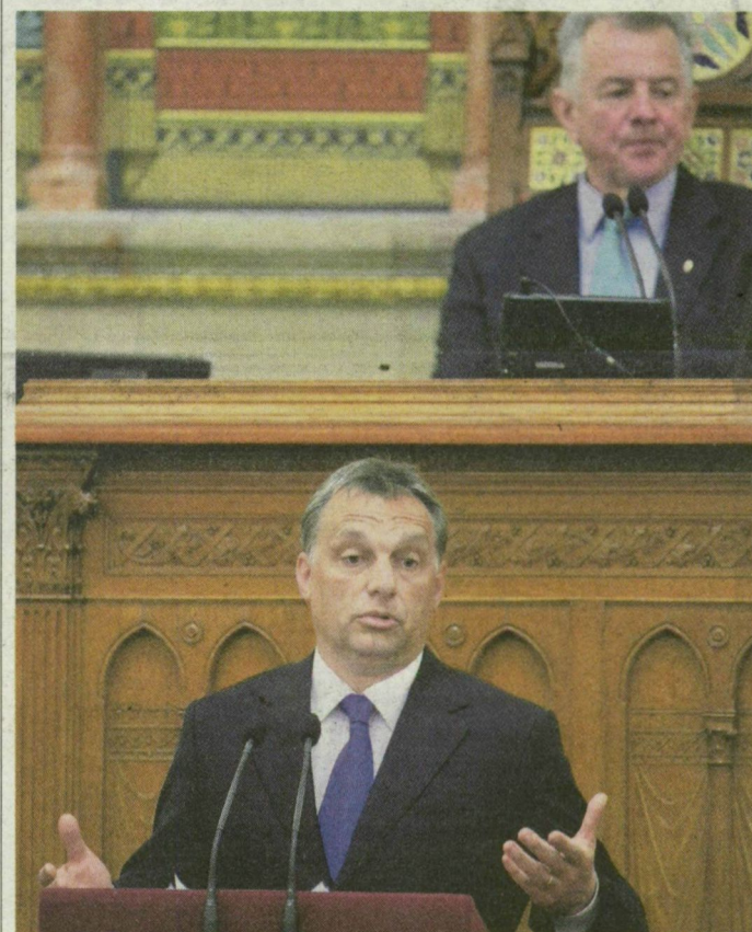
Orbán Viktor terve 2 fő gondolatra koncentrált.

A bejelentést a piacok és a munkáltatók kedvezően fogadták, a szakszervezetek további egyeztetéseket sürgették. Összeállításunk a 2. oldalon