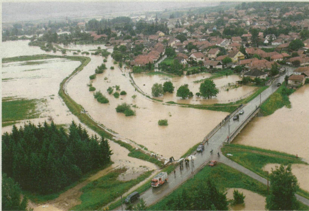
A vízzel körülvárt Szendrőn 120 vásárhelyi katona is segít.

katona 96 technikai eszközzel vesz részt a védekezésben – áll a Honvédelmi Minisztérium tegnapi közleményében. Védelmi és romeltakarító feladatokat 57-en Ócsalános-Várdombérdő, 57-en Gesztelyen, 55-en Belegrád, 52-en Felső-