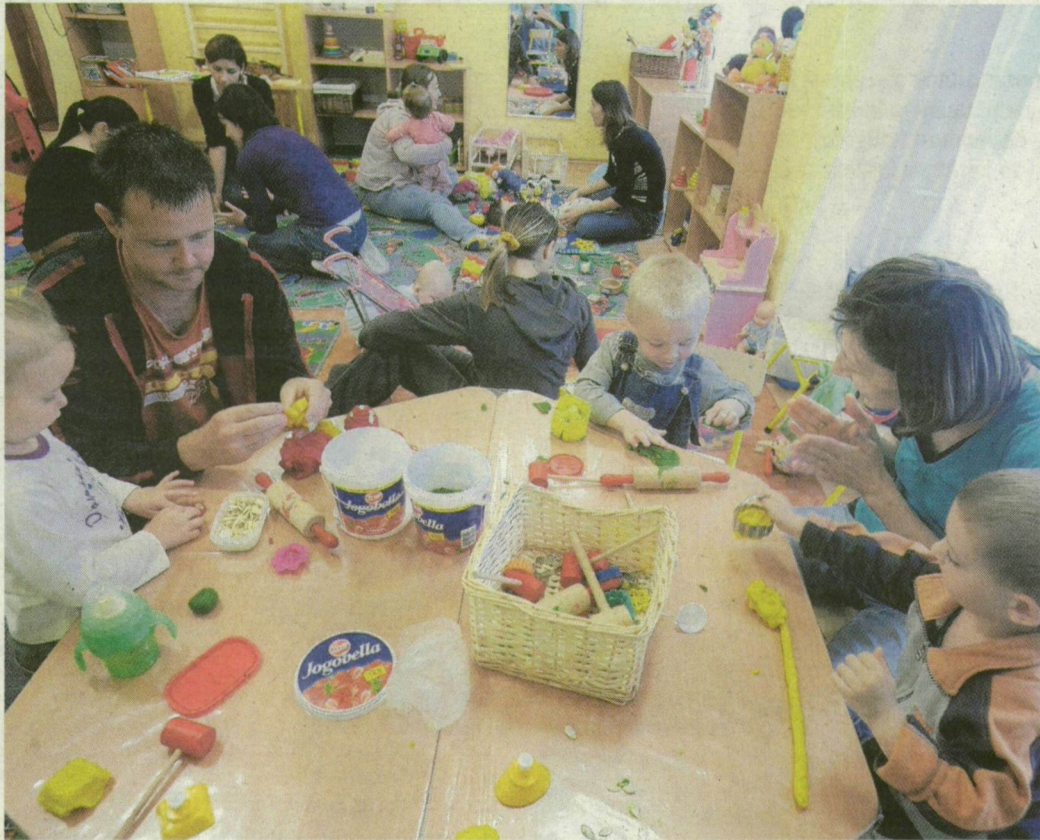
Sokan a jó társaság miatt jönnek – mások szociális okokból.

amelynek része a tétítésmen-tes tízórai is, együtt játszik anya és gyermeke: kézműves-foglalkozásokon vehetnek részt, énekelnek, verseket tanulnak. Sokan egyáltalán