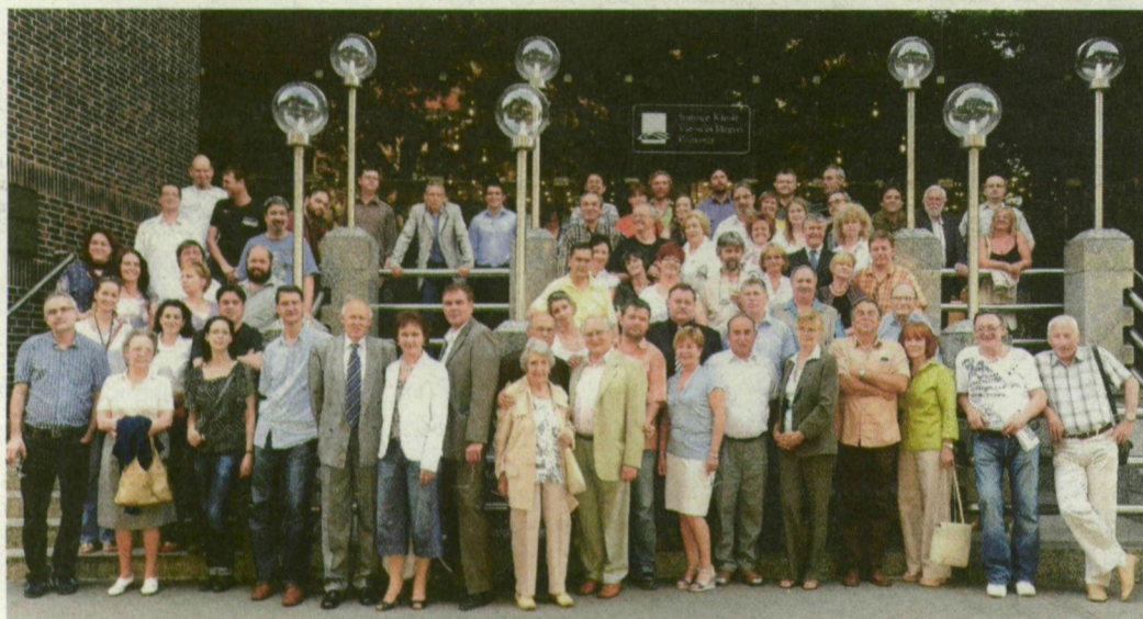
Újságírók, fotósok egymás közt. A Délmagyarország szerkesztőségének egykori és mai munkatársai ünnepeltek – a szakmát, a 100 éves lapot, az olvasót.

ÚJDONSÁG! BIOETANOL: E85 GO: 311,9 • 95: 328,9 • Bio E85: 232 LPG: 170