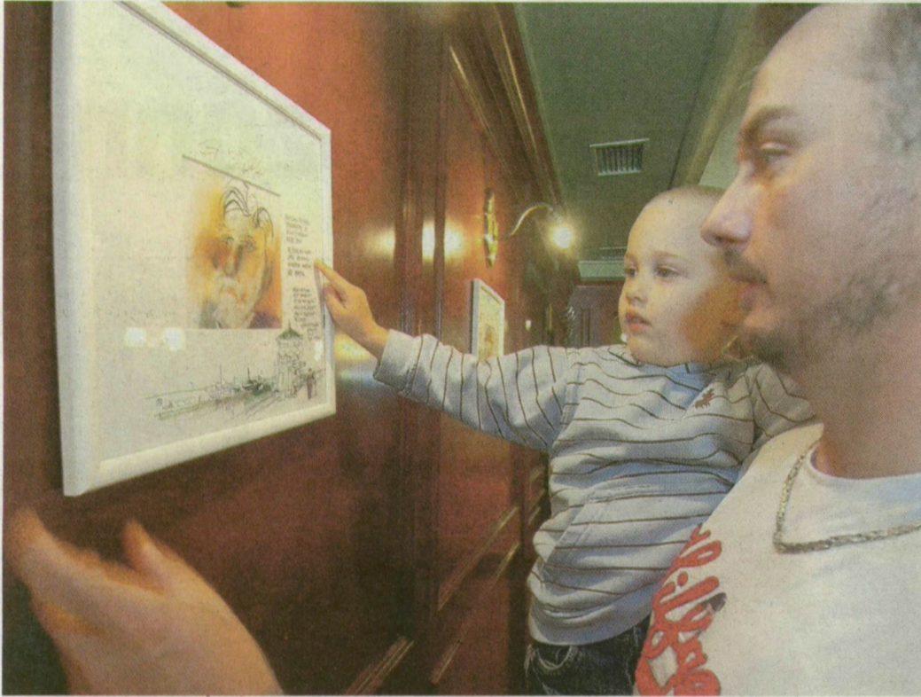
A fotón éppen Gustave Eiffelre csodálkozik rá egy apa kisfiával: kicsik és nagyok egyaránt jól szórakozhatnak Sajdik Ferenc Szegedhez kötődő nagyságokról készült karikatúrákiállításán.