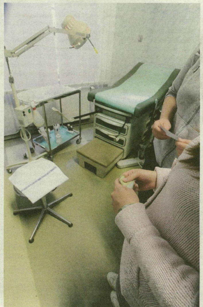
Szegeden tavaly 441 húsz év alatti fiatalnak volt abortusza.