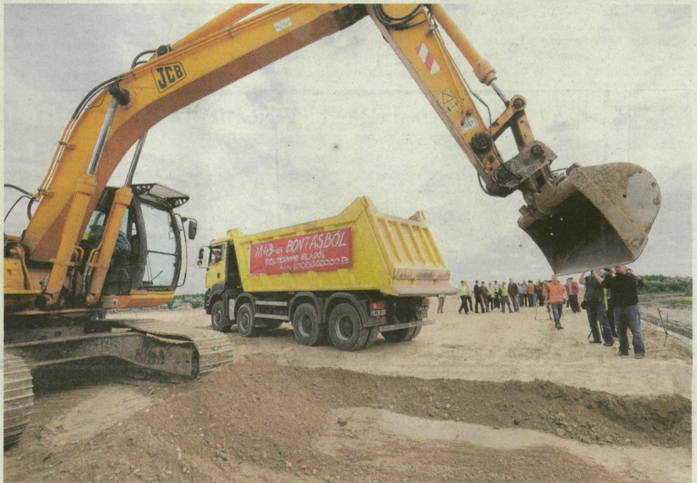
Markolóval kezdték el bontani Szeged határában a 47-es főút felett átvezető autópálya-szakasz töltését.