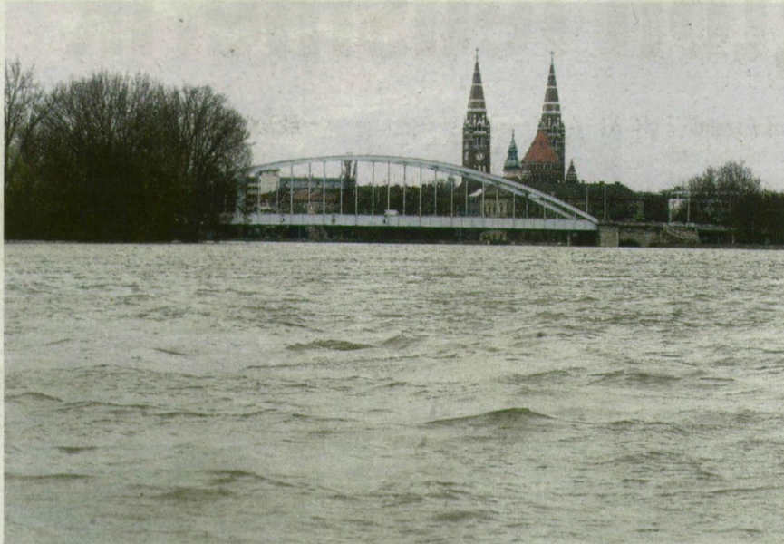
Tengerként hullámzik, az ártéren mindent felfal, de medrében marad a Tisza. Szeszélyes rekorder a szőke folyónk.