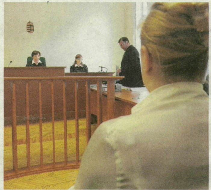
A hódmezővásárhelyi kórház orvosáról még nem derült ki, hogy hibázott-e – a bíróságról már igen.

Újból kell kezdeni a mindszei beteg orvosának perét, mert a Csongrád Megyei Bíróság eljárásjogi hibákat talált az első fokú eljárásban és az ítéletben. A kezdetek óta nagy médiaérdeklődés előtt zajló büntetőügy három éve tart.