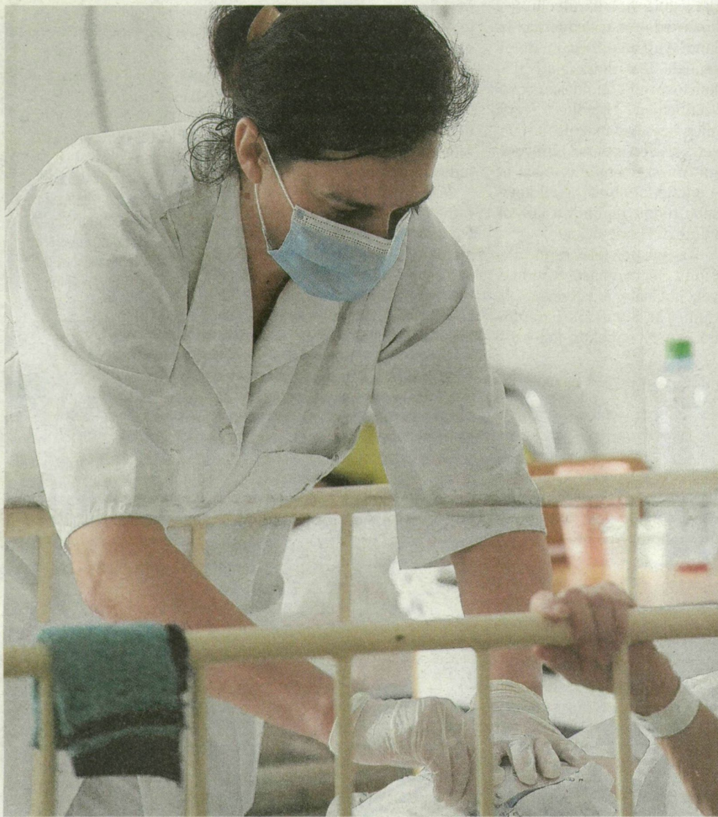
Az utóbbi öt évben nem emelkedett az egészségügyben dolgozók bére.

2004 és 2008 között „eltűnt” a kórházi szakdolgozók 17 százaléka – leépítették őket, vagy elvándoroltak az ágazatból. A betegek mellett még megmaradt középkorú szakemberek úgy érzik: három helyett dolgoznak, miközben munkájukat alulfizetik.