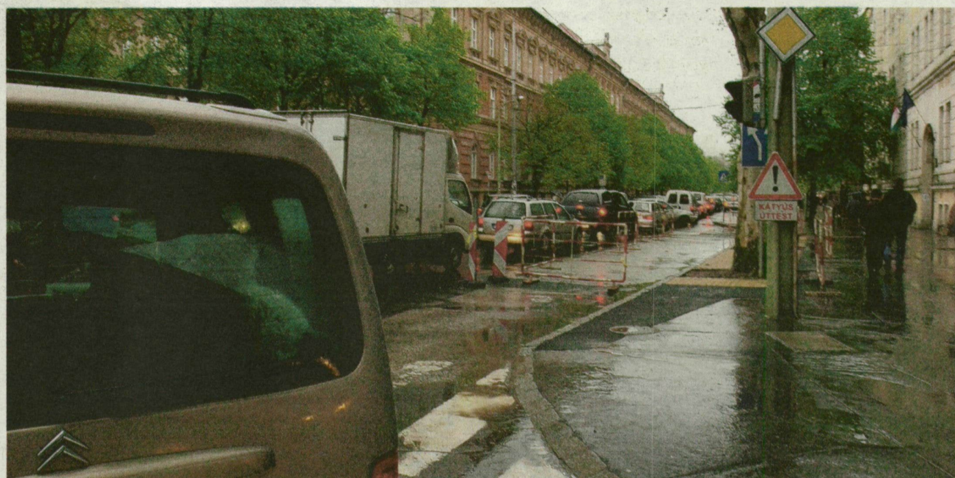
Kerülgetik az autósok a Tisza Lajos körúton a Gödör étterem előtti trolimegálló friss betontját.

Ami nehezítheti a Szentháromság utcán és a Boldogasszony sugárúton közlekedők életét, az mind adott volt tegnap a reggeli csúcsban és napközben is. Sötét lámpák, útszűkület, egyirányúsított utcák, eltűnt parkolóhelyek fokozták a káoszt. Kritikus helyzetet a türelmetlen sofőrök okoztak.