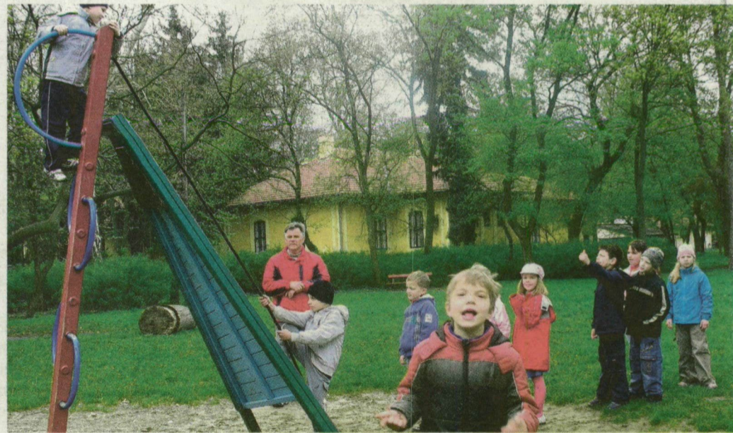
A játszótér is megújul az átalakítás során.

Mire végeznek a ligetben, megkezdődhet a Csallány Gábor Kiállítóhelyre keresztelt