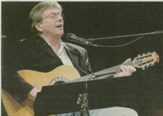
Zorán egyik dalát sem szereti jobban, mint a többi.

A Kossuth-díjas előadóművész tavaly megjelent, 34 dal című válogatáslemeze nemrégiben elérte a platinastátust. Zorán úgy van a dalival, mint az ember a saját gyermekével: egyiket sem szereti jobban, mint a többi. Zoránnal készített beszélgetésünk a Sziesztában