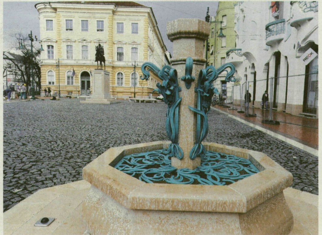
Hangulatos találkahely lesz a Reök-palota előtti tér.