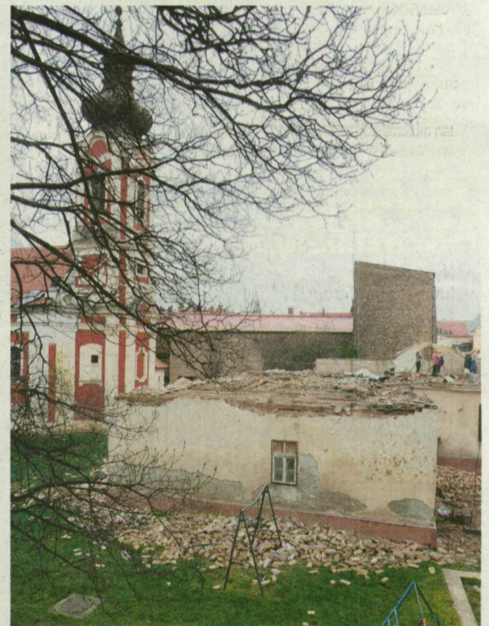
Az egykori görögkeleti paplakot bontják – helyén épül meg az új PMK.