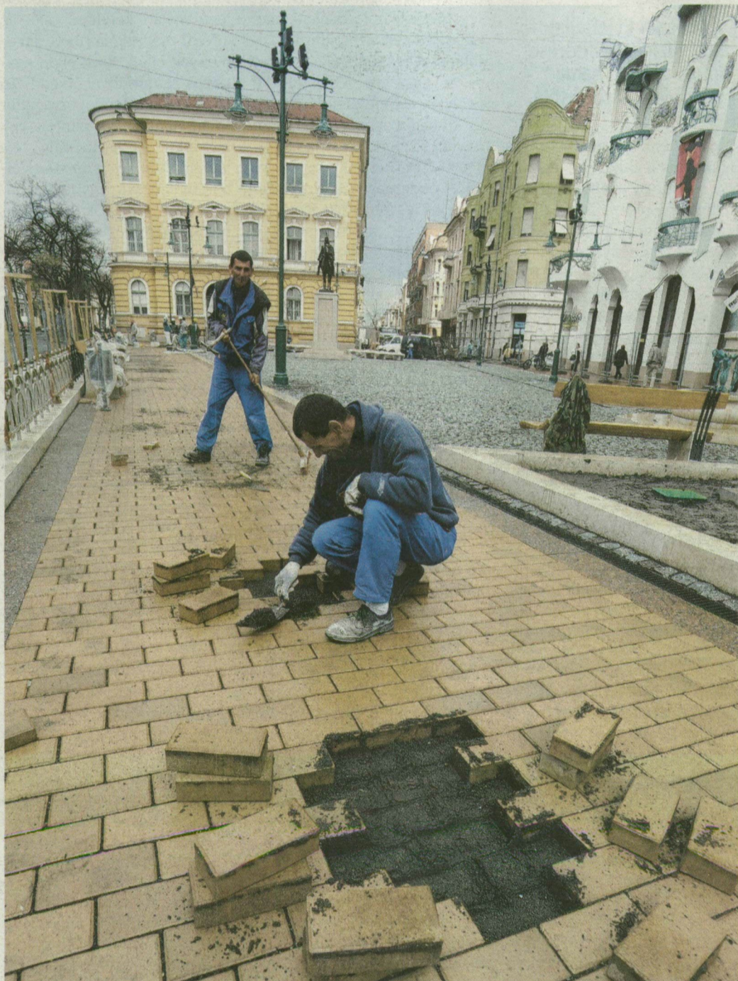
A Lófaraként ismert díszter burkolatát tegnap még építették.