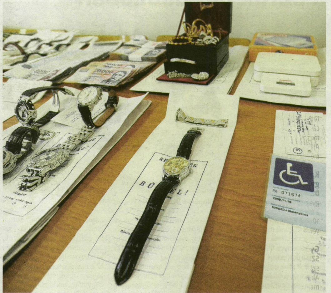
A lefoglalt tárgyakat tegnap mutatta be a rendőrség a sajtó képviselőinek.

helyszíntől egy sarokra kapták el a két debreceni és egy szegedi gyanúsítottat, akik még a rendőröket is meglepő profizmussal „dolgoztak” az elmúlt időszakban a városban.