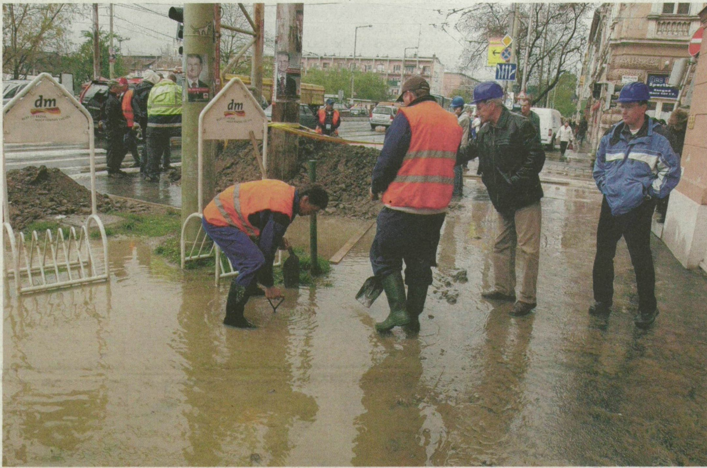
Bokáig érő vízben dolgoztak a Vízmű szakemberei a Mikszáth Kálmán és az Attila utca közötti járdaszakaszon.

Bokáig érő víz borította el tegnap délelőtt a Mars tér és a Mikszáth Kálmán utca sarkát – egy út alatti fúrás miatt eltört egy vízvezeték. Egy ház órákig víz nélkül maradt, a nagykörút külső sávjának lezárása miatt kisebb dugók alakultak ki. Délutánra állt helyre a rend.