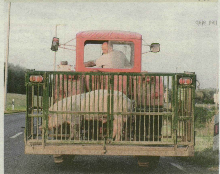
Ki tudja, hová visz a megtermett disznó útja: annyi biztos, hogy gondos sofőrje akadt, aki hátra-hátrapillantva ellenőrzi, megfelelő-e rőfögő utasának a komfortfokozat.