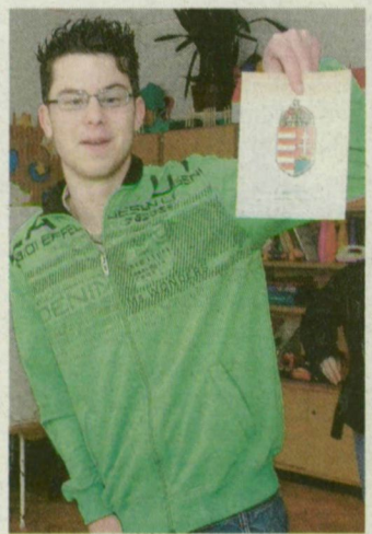
Csongrád megyében 4407 első szavazó járult az urnákhoz. Őket emléklappal köszöntötték.

KISTELEK: URNÁTÓL A CUKRÁSDÁBA. – Bemondta a kistéleki rádió is: nagyobb a nyüzsgés, mint 4 éve – mondta egy idős pár a város bevásárlóközpontja előtt. Fontosnak tartják a szavazást, kora délután leadták voksukat – este pedig figyelték az eredményeket. Egy család nemcsak a szavazólapon töltötte ki az iskolában, a beiratkozási információkat is begyűjtötte, majd a cukrárszába indult. – Nem befolyásolja a választás a vasárnapunkat, mindent úgy csinálunk, mint máskor. Ha esett volna az eső, nem is indulunk útnak – árulta el a családfő. A 6014 választópolgár 57,1 százaléka, 3471 szavazó járult az urnákhoz.