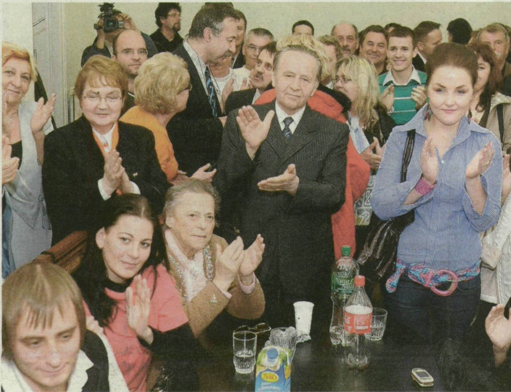
Győztesek éjszakája. A választási sikert ünneplik a Fidesz szegedi irodájában.

Elsőprő győzelmet aratott a Fidesz-KDNP az országgyűlési képviselő-választások első fordulójában. A nyolc évig kormányzó MSZP súlyos vereséget szenvedett. Két új párt, a Jobbik és az LMP is bekerült a parlamentbe. A rendszerváltó MDF viszont nem érte el a bejutást jelentő 5 százalékos küszöböt.