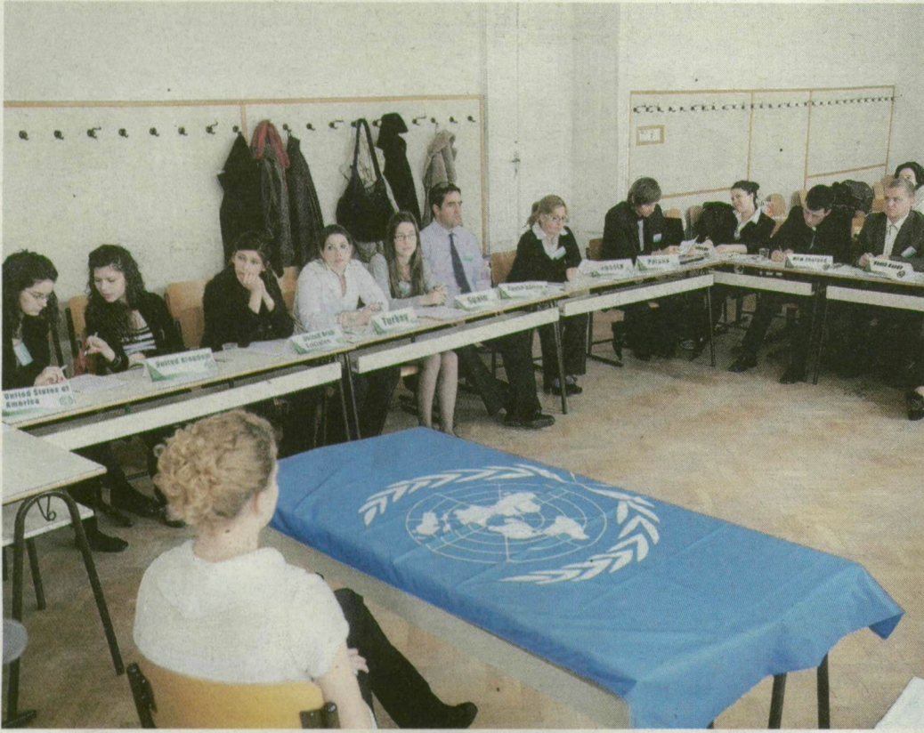
A bizottsági munka során a konferencia résztvevői lobbiznak a határozatokért.