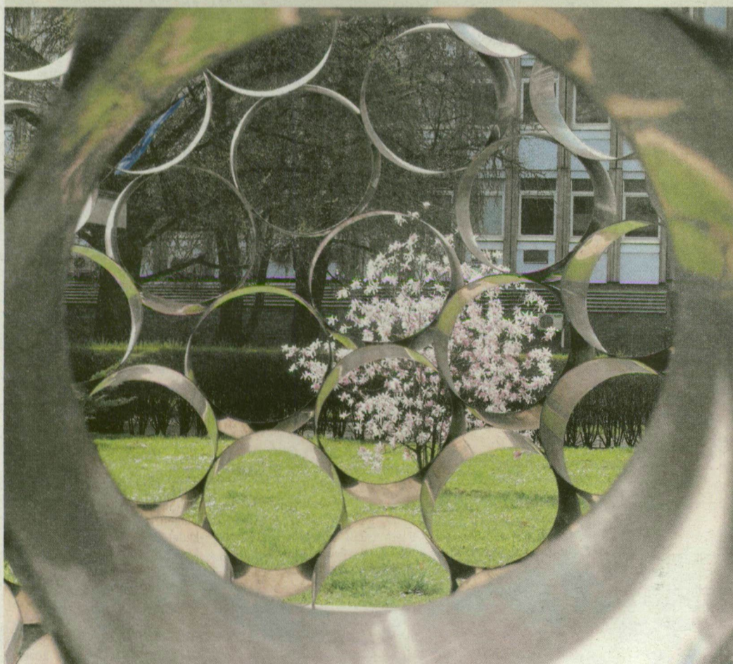
A Szegedi Biológiai Központ parkjában különleges szemszögből örökítette meg olvasónk a virágzó fa ágait.