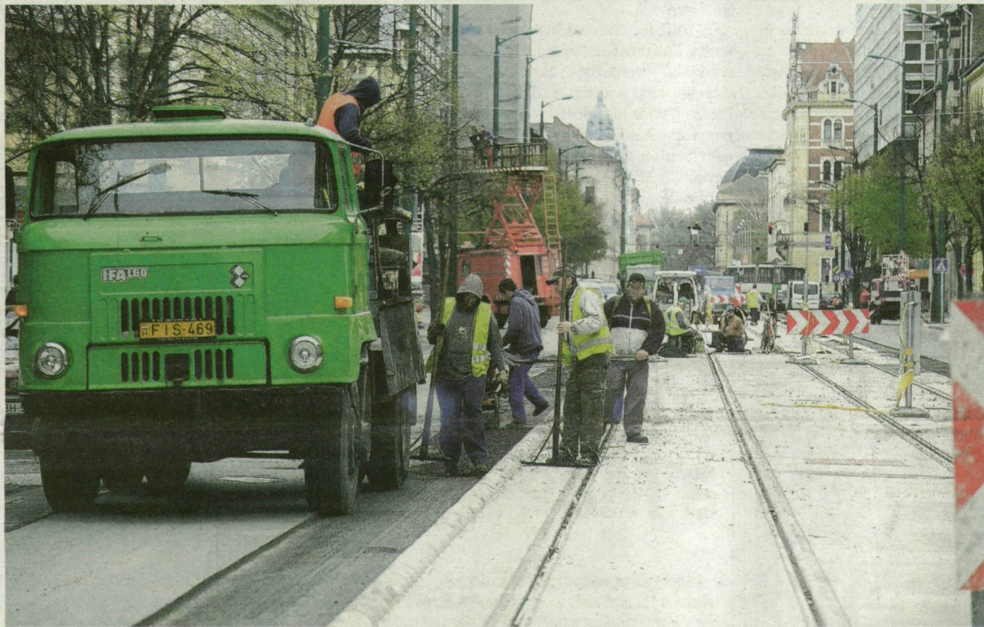
Holnap egy sávon mindkét irányban megnyitják a Kossuth Lajos sugárutat.

SZEGED. Az eredeti rendben lehet autózni holnaptól a Kossuth Lajos sugárút nagy részén. A Tisza Lajos körúttól a nagykörútig mindkét irányba egy sávon mehetnek a járművek. A Párizsi körúti kereszteződésen