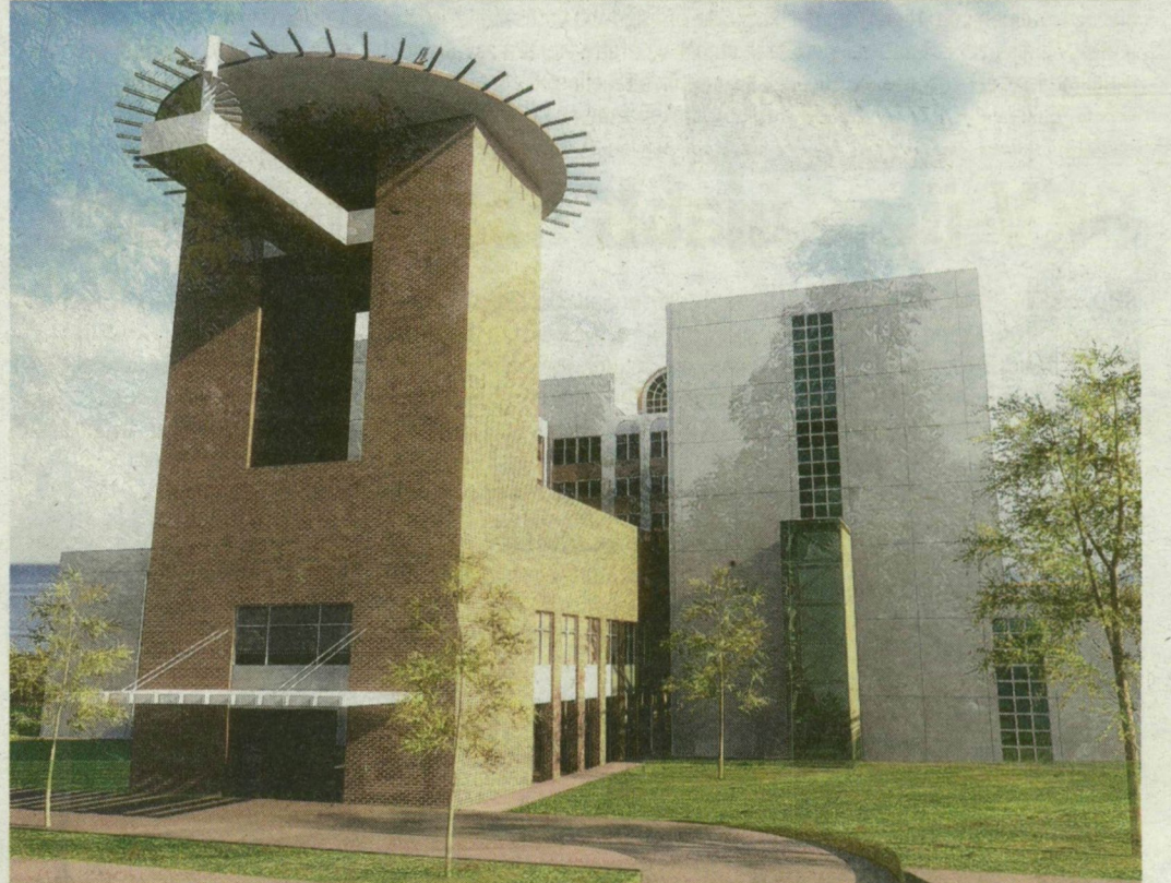
A Szegedi Tudományegyetem új klinikai tömbjének földszintjén korszerű sürgősségi betegellátó osztályt alakítanak ki – ide érkezik majd minden mentő a régióból. A 676 millió forintos támogatási szerződést tegnap írták alá. Képünkön az új osztály látványterve. Részletek a 3. oldalon