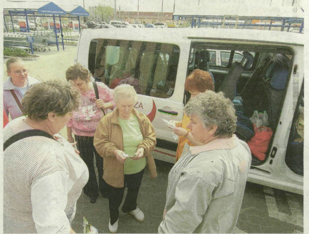
Kübeki asszonyok a szegedi bevásárlóközpont parkolójában.

don virágföld is került. Nincs elég föld Kübeken? – kérdezik az otthoniak is, de az asszonyok szerint bizonyos felada-