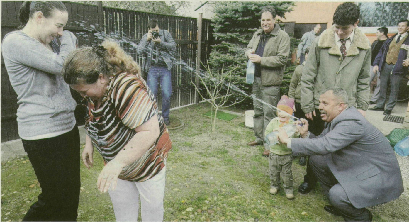
Újszentivánon nem kímélték a lányokat: szódásüvegből áztatták el őket.

SZEGED-KISKUNDOROZSMA. Egész napos nemzetközi konferenciát rendez a Kárpát-medencében élő romaság helyzetéről az Együtt a Romákért szervezet holnap délelőtt fél 10-től a művelődési házban (Negyvennyolcas utca 12.).