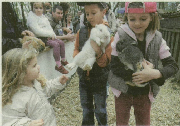
A Szegedi Vadasparkban nyuszikat simogattak a gyerekek.