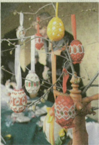
Elkészültek a hímesek.