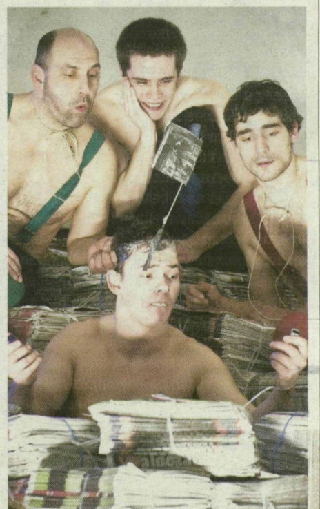
Jelenet a Maladype Színház Übü király-produkciójából.

A jegyeket érdemes előre megváltani, hiszen az érdeklődés eddig is olyan ki-