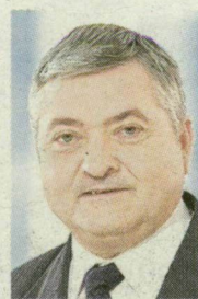
VINCZE LÁSZLÓ (FIDESZ-KNDP):

ciklusban több éven keresztül, 1994 óta pedig folyamatosan vezetem a Független Kisgazdapárt Országgyűlési Képviselőcsoportját.” 2006 szeptemberi MTI-hír: „Új párt élén tér vissza Torgyán József”. „Indoklása szerint azért, mert nem tudja tovább elviselni a jelenlegi, elfogadhatatlan közállapotokat. Az Orbán-kormány volt földművelésügyi és vidékfejlesztési minisztere azt mondta: a saját párt alapításával, a keresztény-nemzeti erő létrehozásával elsősorban a fiatalokat szeretném meggyőzni, mert álláspontja szerint a megújulásra rájuk van szükség. Mellettük vállalkozókra, gazdákra, munkásokra számít. A kisgazda eszmeiséget szeretné feltámasztani és annak programját végrehajtani.”