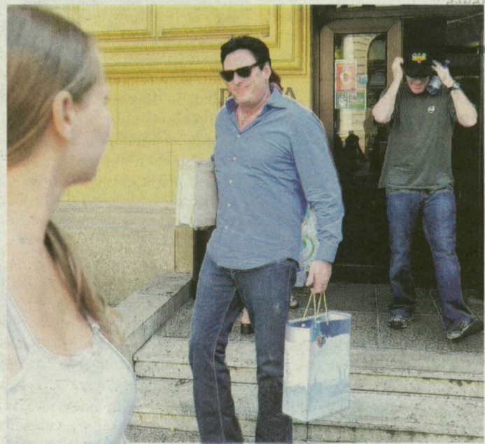
Michael Madsen a szegedi színházban.