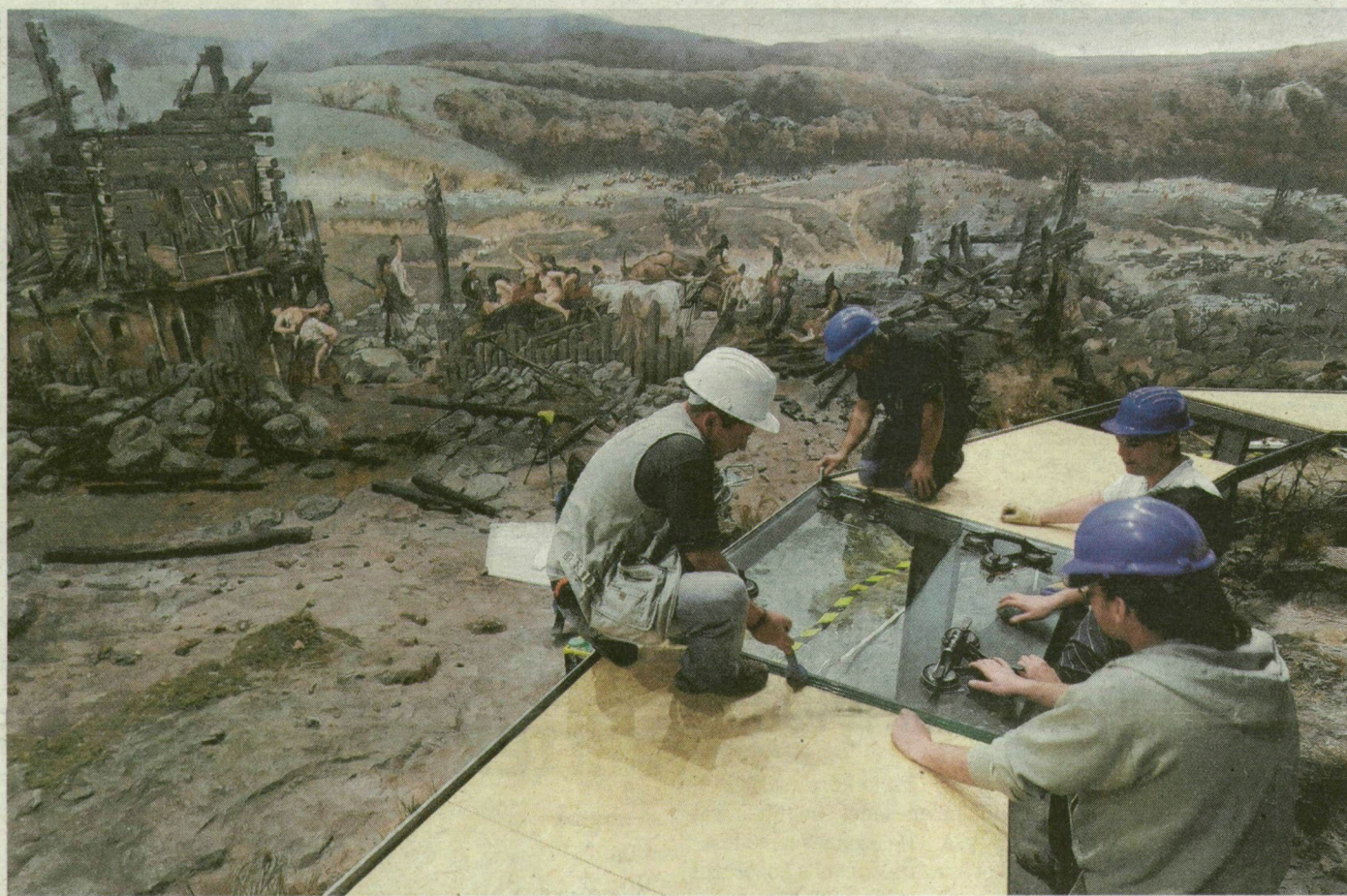
Munkások a Honfoglalás kellős közepén. A körképet ezután az épülő ösvényről közelebbről is meg lehet nézni.

Élénkebb színű honfoglalók, új terepasztal, a képhez közel vezető „üvegösvény” várja húsvétól az ópusztaszeri emlékpark látogatóit. Közben kívül és belül is dolgoznak a főépületen, a 640 milliós beruházás nyomán nyárra elkészül az 5 új kiállítás.