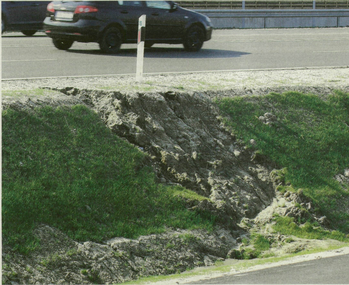
Szakszerűtlenül és gyenge minőségben elkészített földmű – mondja a mérnök.