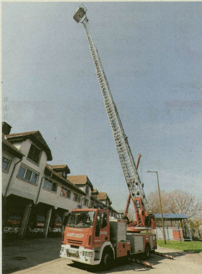
145 millió forintba került a tűzoltóság büszkesége.