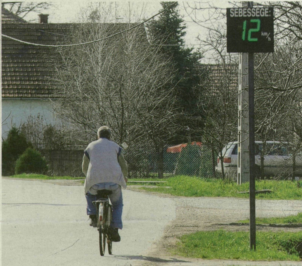
Az újszentiváni biciklis csak 12-vel teker. Őt nem figyelmezteti a „Lassíts” felirat.

Csak az autóvezetők 66 százaléka tartja be az engedélyezett 50 kilométeres sebességhatárt – tanúskodnak a veszélyes forgalmi gócpontokban, lakott területeken elhelyezett digitális sebességmérők. Ezek nem büntetnek, csak figyelmeztetnek – sok autós 100-zal húz el a „Lassíts” felirat mellett.