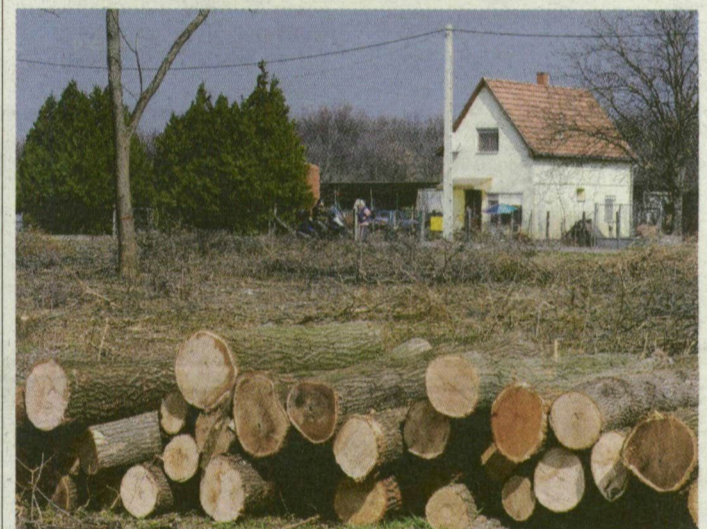
Kivágtott farönkök az erdősáv helyén.