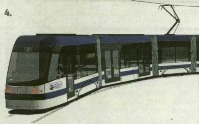
A delmagyar.hu-n lehet szavazni a villamosok színéről: hagyományos (1.), környezetbarát (2.), napfényes (3.), modern (4.). LÁTVÁNYTERV

rülbelül 15, Debrecennél pedig 30 százalékkal kisebb a büdzsé a reálisnál”. Információink szerint a borsodi megyeszékhelyen ma rendkívüli közgyűlés keretében hirdettek eredményt.