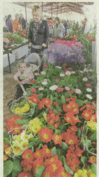
Virágtengerré változott a Mars tér Szegeden.