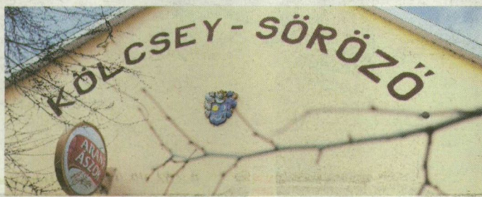
A Kölcsey sörözőn csak a városcímer használatát kellett engedélyeztetni.