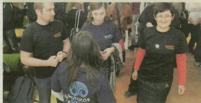
Agyi sejteket nézhetett meg, a morfin fájdalomcsillapító, illetve függőséget kiváltó hatását mérhette tegnap több mint háromszáz középiskolás az SZBK-ban. A Szegedi Biológiai Központban – kapcsolódva a világmozgalmhoz – az agykutatást népszerűsítették.