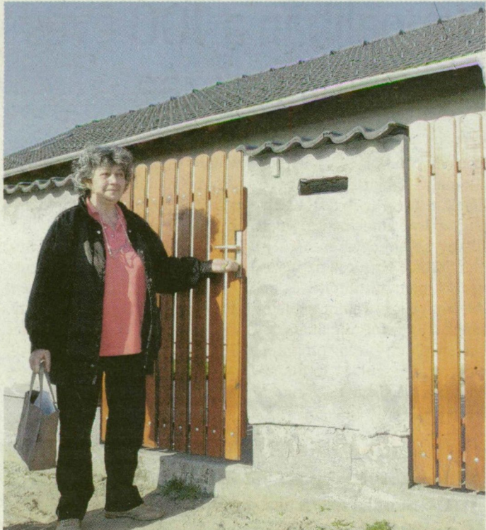
Megtalálták a kiskaput. Nem árverezik el Szűcsék házát.

100 millió forintos hitelt vesz fel a Sikeres Magyarországért bérletprogramban Mórahalom, hogy segítsen annak a 6-8 családnak, amely nem tudja fizetni lakáshitelének megemelkedett törlesztőrészeit.