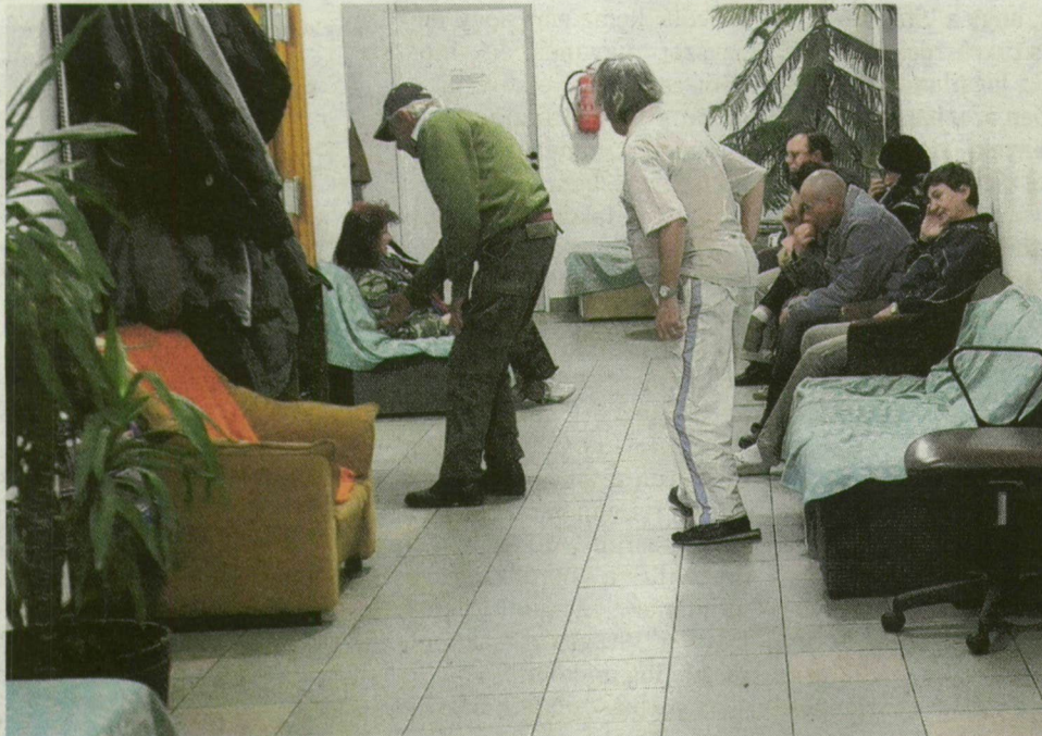
Egy helyen üzemel a 22 férőhelyes átmeneti szállás, a 20 fő befogadására alkalmas éjjeli menedékhely és a melegedő.

A közösség összetartó, legalább 30, évek óta a szállón élők, vagy oda visszajáró állandó taggal. A vezetőséggel együtt úgy döntöttek: dohányozni