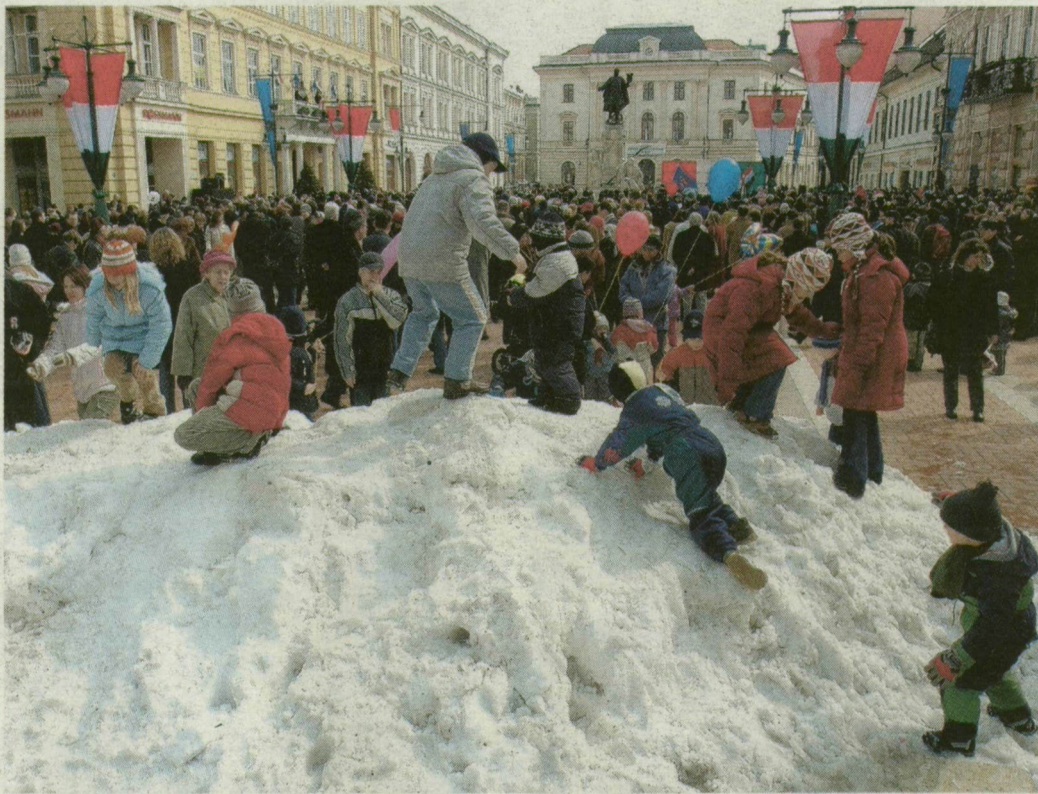
2006. március 15. A gyerekek hóban játszottak a Klauzál téren.

Hétfőre szeles időt mond a meteorológia, viharos szellőkészek, elszórtan hózáporok is előfordulhatnak. Néhány órára kisüt a nap, a hőmérséklet 8 fokig emelkedik. A hó addigra elolvad.