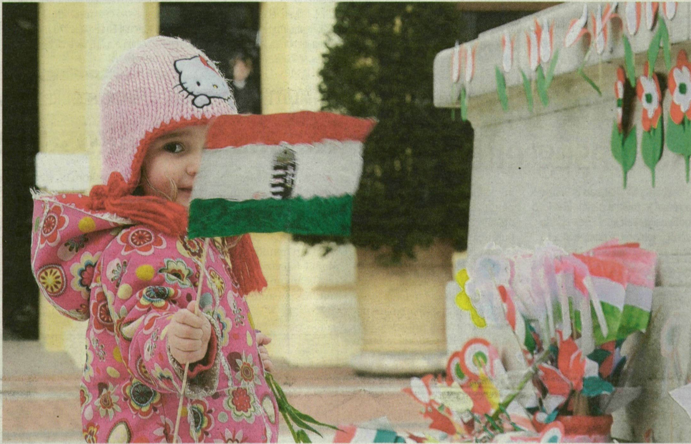
A saját színezésű zászlókra mindig büszkék a legkisebbek.

– Az iskolai ünnepély miatt is kitűztem a nemzetiszínű szalagot, de az egyetemi gyakorlóba járó fiamnak is adtam egy kokárdát, ott is megemlékezést tartottak – árulta el a Vedres-szakközépiskola taná-