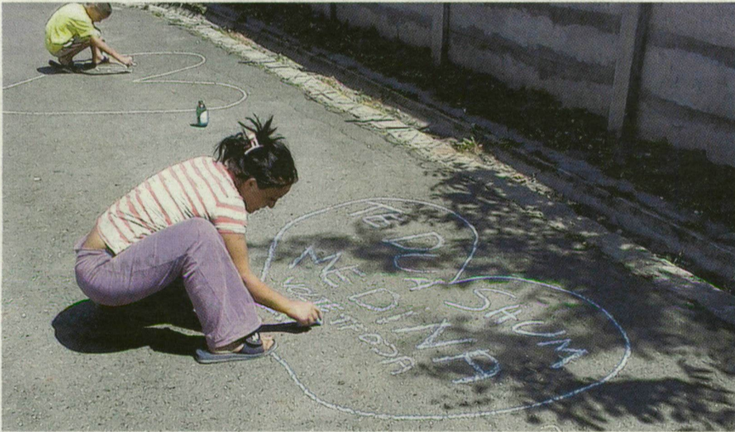
Gyerekek rajzolással mulatják az időt a tábor területén.

Gornij-Serpak a Tisza-parton. A délszláv háború elől a volt Jugoszláviából tömegesen hazánkba áramló menekültek között az is előfordult, hogy egész falu érkezett együtt. Így volt ez a bosnyák Gornij-Serpak lakóival, akiket egy az egyben a nekik nyitott csongrádi altáborba költöztettek. Az 1995-ös békekötés után többen közülük továbbálltak Nyugat-Európába, mások hazatértek. A tábort bezárták, és azóta sem működik hasonló.