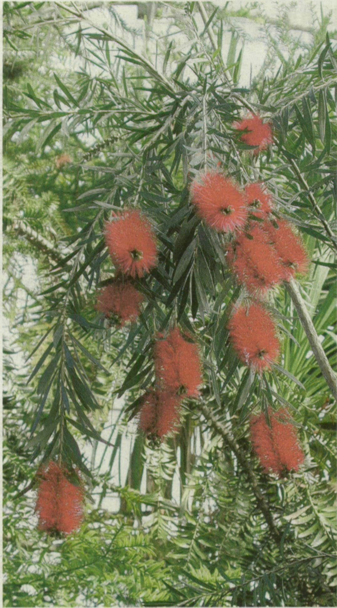
Cook kapitány teát főzetett legénységének a látványos üvegmosófa leveleiből.

A növény egyébként Ausztráliában őshonos, ahol dísznövényként termesztik, kisebb méretben. Felfedezője, Cook kapitány ennek a cserjének a leveleiből főzetett magának és legénységének teát, amikor készleteik kimerültek. Az üvegmosófa nemcsak látványos, illatos is: ha szétmorzsoljuk a leveleit, kellemes citromaromát áraszt. Eredeti lelőhelyén