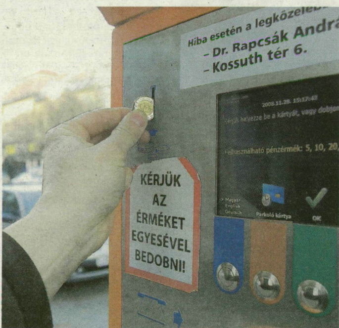
A Rapcsák úti fizetőparkoló megszűnik – másutt viszont újak létesülhetnek.

Szegeden 300 hely szűnik meg. Ahogy azt nemrégiben lapunkban megírtuk, ez év végéig a nagyberuházások miatt 200 parkolóhely szűnik meg, jövőre pedig újabb 100-at számolnak fel a szegedi belvárosban. Az önkormányzat célja itt is az, hogy kiszorítsa az autósokat a központból. Viszont tervezik, hogy a Dugonics téren mélygarázst építenek – ez és a Honvéd térre magántőkéből tervezett parkolóház hivatott megoldani a helyzetet.