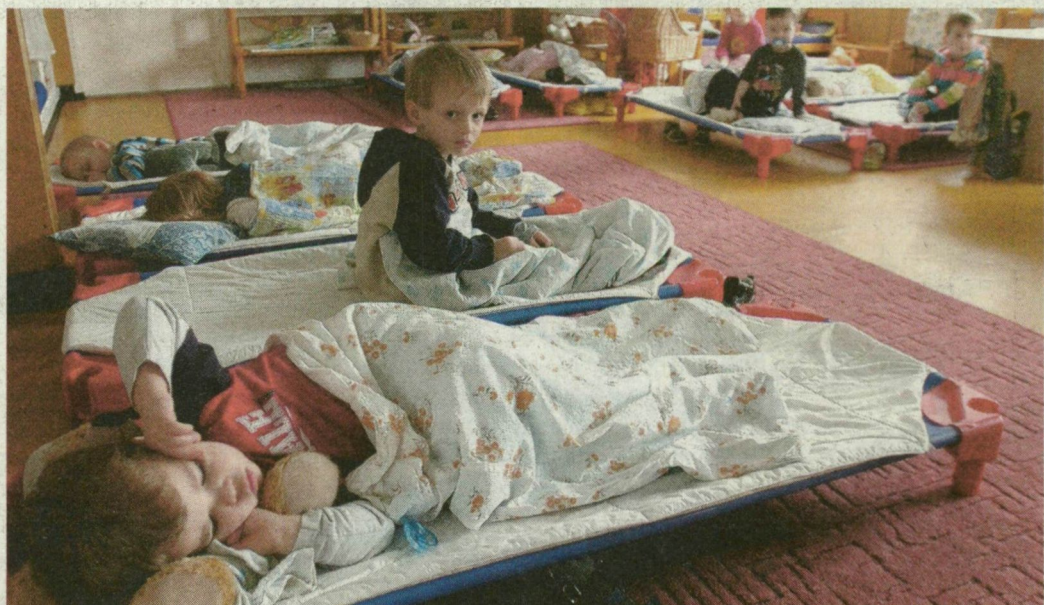
Csendélet a szegedi Agyagos utcai tanbölcsődében. Egyre többen szállnának be a csapatba.

– A legtöbb szegedi bölcsődében már csak 2011 szeptemberétől van hely. Tavasszal kezdődnek a beiratkozások, de én is, mint a legtöbb anyuka, már januárban elkezdtem keresni a legközelebbi bölcsit – panaszkodott Ceglédi Anna. Nemrég derült ki, hogy a fiatal tanárnőnek idén szeptembertől vissza kell mennie dolgozni. Elmondta: három bölcsőde jöhetett számításba. A Dobó utcaiban 30 helyre több mint 40 gyerek van,