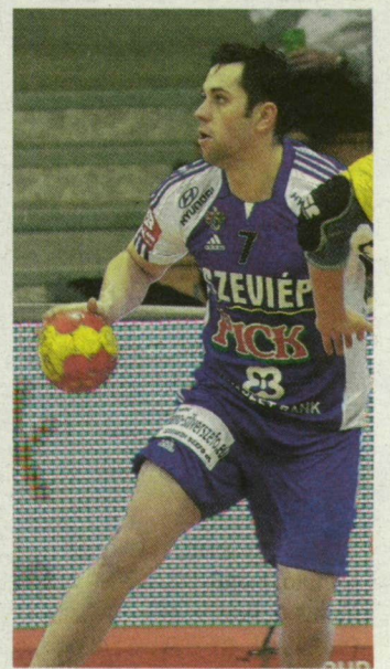
Vadkert győzelemmel zárta a BL-t.

17 óra között elővetelben is váltható. A DAKE (a szurkolók egyesülete) szervezésében ingyenyjegyek igényelhetők az info@pickfunok.hu e-mail címen, korlátozott számban.