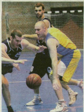
Nagy harc várható.

Kezdjük a sort az NB I/B csoportos férfi kosárlabda-bajnokság megyei rangadójával. A szegedi együttes jelenleg a harmadik helyen áll – egy meccsel kevesebbet játszott –, míg a Vásárhely második. Az őszi derbi is kiélezett csatát hozott (93–85 a