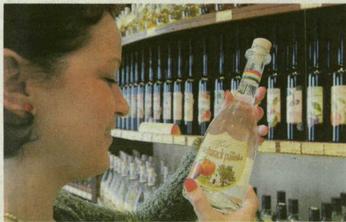
Ízkavalkád a Magyar Pálinka Háza szegedi üzletében.

Az első Magyar Pálinka Háza a fővárosban 7 éve azzal a