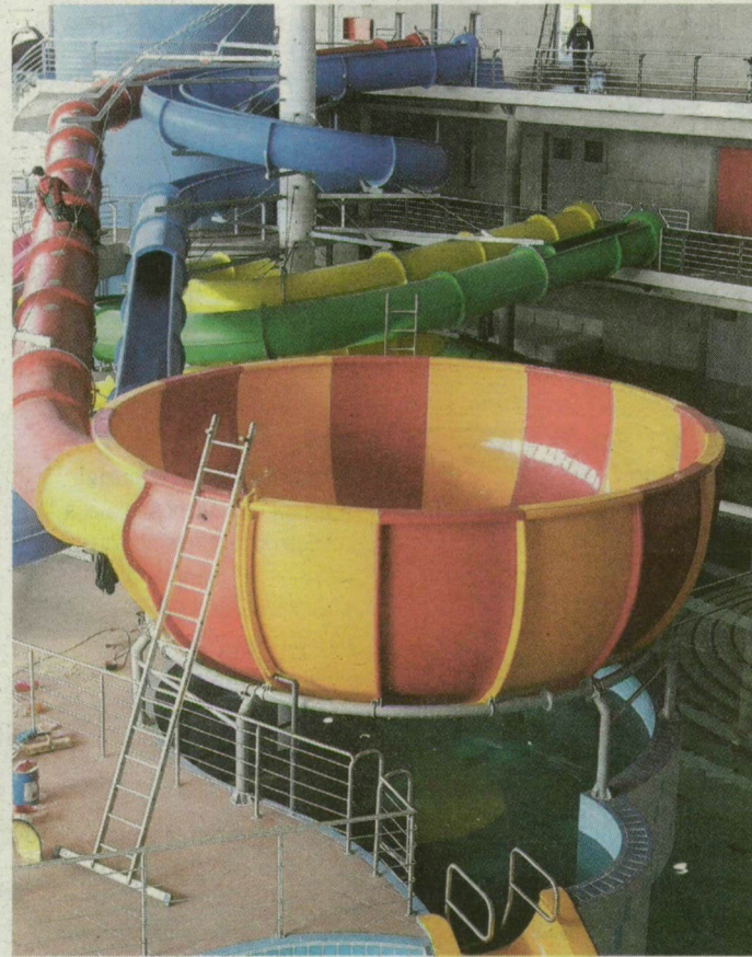
A színes csúszdáknak már csak a biztonsági tesztet kell kiállniuk, hamarosan jöhetnek a vendégek.

Kocsinkat az újszegedi Jankovich utcában hagytuk, ahonnan az alig 100 méterre lévő, és szintén felújítás alatt álló Forrás Szállás sétáltunk fel: utunkat tócsák, megszáradt sárhalmok és a minden szabad helyet parkolásra használó autók övezték. A szálloda Szent-Györgyi Albert utca felé néző homlokzatának harmadát még állványok takarják: úgy láttuk, hogy még jó időbe telik a háromcsillagosból négycsillagosá váló szálloda megnyitása. Az utca sarkán markológépek sipoltak, dudáltak és toltak; kicsit fentebb a járdát törték fel a munkások, miközben az elzúgó munkagépek felkavarták